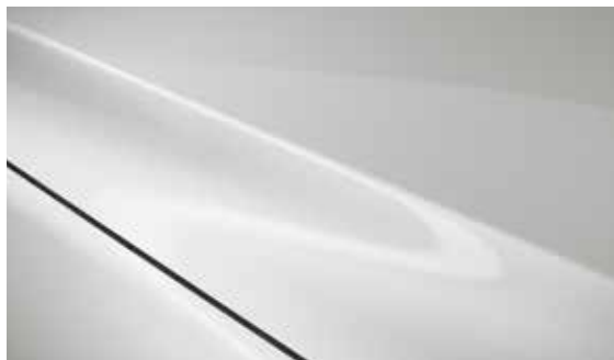
Snowflake Weiß (25D)