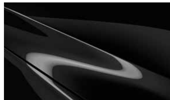
Jet Schwarz (41W)