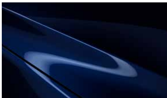
Deep Crystal Blau (42M)