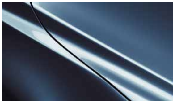
Eternal Blau (45B)