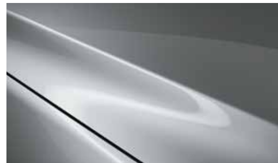
Sonic Silber (45P)