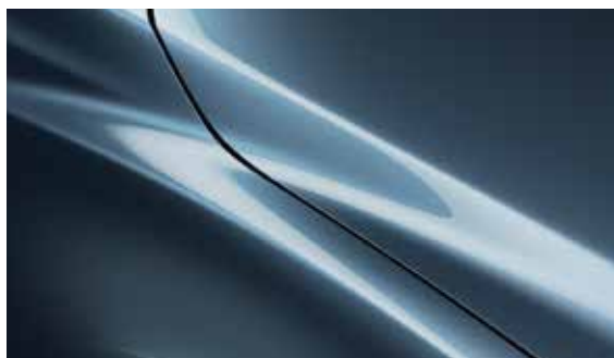
Reflex Blau (42B)