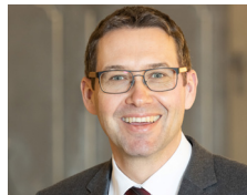
Markus Vogl Bürgermeister Stadt Steyr